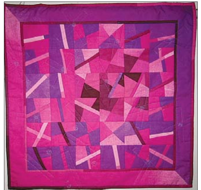
Tilkuista koottu vaaleanpunainen työ nimeltään Pinks. Työn koko on noin 60x60 cm ja sen tekijä on tilkkukurssin opettaja Inga Pihlhjerta.