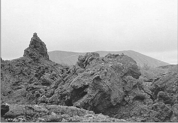
Lavaformationer vid vulkanen Hverfell, nordöstra Island

Vår farmor bar på så mycket självlärd visdom om naturen, det hade generationer före henne lärt sina ättlingar. Hon var född och uppväxt i Helsingfors på Åbergs torp alldeles intill en stort kärr. Måhända var denna våtmark den sista kvarlevan av Litorinahavet, som för mycket, mycket länge