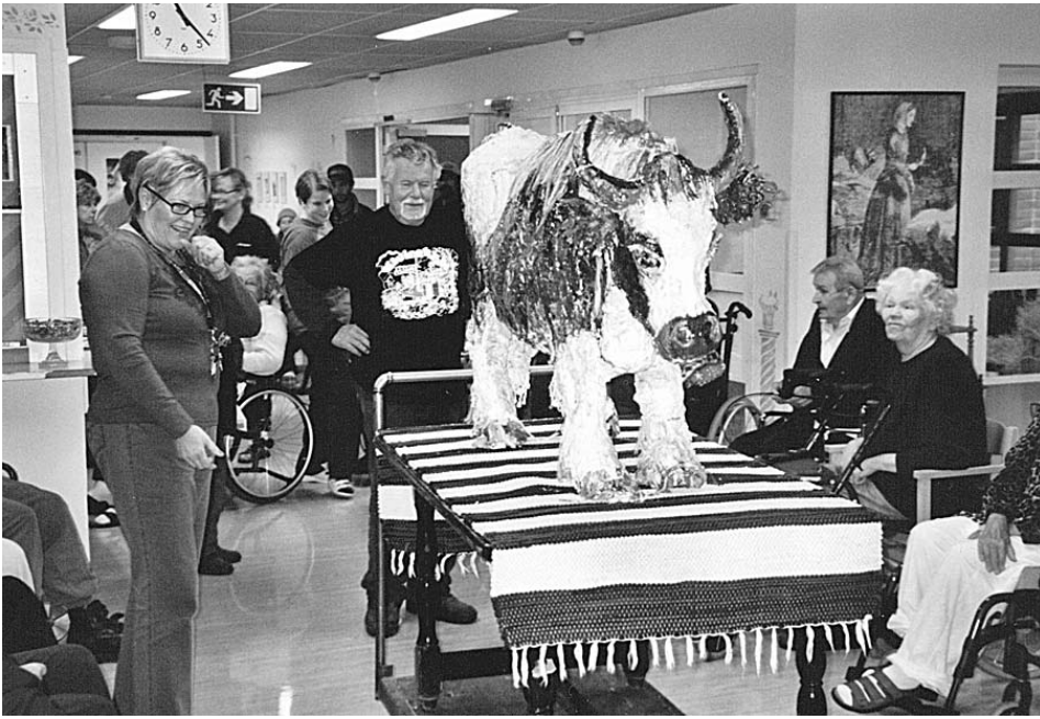
Osmonkallion vanhainkodin asukkaat ottivat ilolla vastaan pohjois-siperialaista lehmää esittävän patsaan.