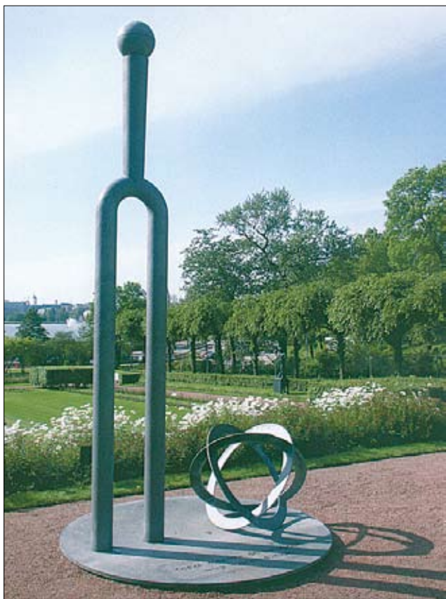
Itsenäisyydenpuiston ensimmäinen ympäristötaideteos on Antero Toikan Aria. Galvanoitua terästä oleva teos valmistui vuonna 1994. Teos Helsingin kaupungin talvipuutarhassa vuonna 2004.

Tilavaraukset vahtimestarilta 050 408 2220. Jätä viesti vastaajaan.