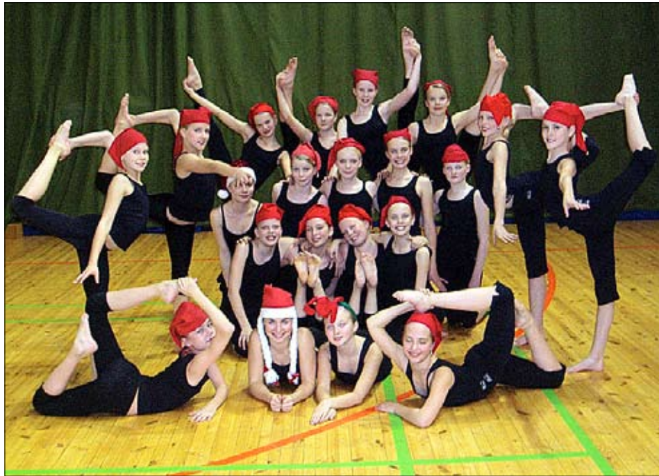
Pakilan Naisvoimistelijoiden joukkuevoimistelijat joulutunnelmissa.