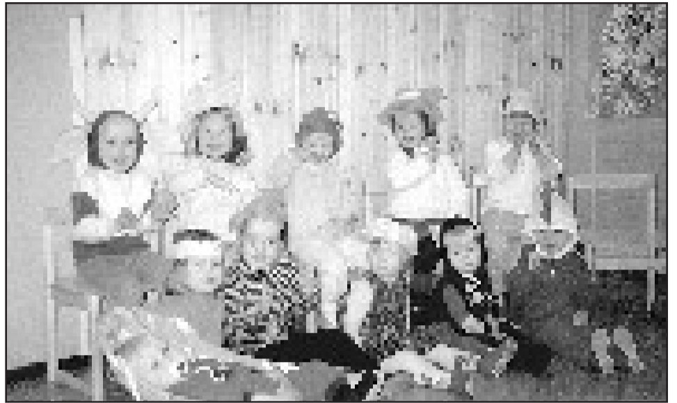
Patolan päiväkotia on yhden ryhmän viidentoista lapsen päiväkotia. Ryhmissä on eri-ikäisiä lapsia ja myös sisarukset ovat samassa ryhmässä. Päiväkotia pitää yllä kannatusyhdistys ja sen hallitus koostuu lasten vanhemmista. Patolassa vietettiin iloisia päiväkodin 30-vuotisjuhlia.

Päivähoitoa ollaan "tasapainottamassa" myös täällä pohjoisessa suurpiirissä. Tasapainotussuunnitelma perustuu sekä väestöennusteeseen että sosiaalilautakunnan päätökseen nostaa päiväkotien käyttöaste vä-