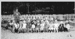
Kuvaa voi tilata Foto-Nonasta, Ogelin Liikekeskuksessa.

Lehtemme viime numerossa olivat Riitanpuiston tarhalaiset yhteiskuvassa, joka vetosi lukijoiden tunteisiin ja herätti ihastusta.