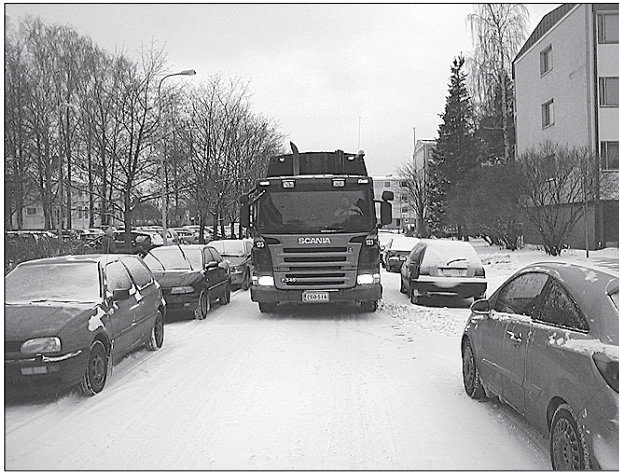
Näin roska-auto tukki tietä 7.1.2008 vapaan pysäköinnin aikana.

MONET muualta Oulunkylään tulevat autoilijat käyttävät Torivoudintietä pysäköintipaikkana ja jatkavat junalla keskustaan. Täyteen pysäköidyt kadut ovat hankaloittaneet kadun huolto- ja hälytysajoa.