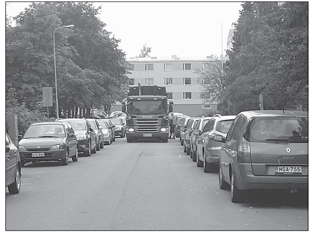
Tämä on tilanne 18.8. kolme viikkoa sen jälkeen, kun kaupunkisuunnitteluvirasto on "korjannut" tilanteen.