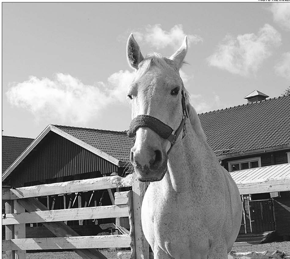
Tuomarinkylässä on hyvät ratsastusmahdollisuudet.