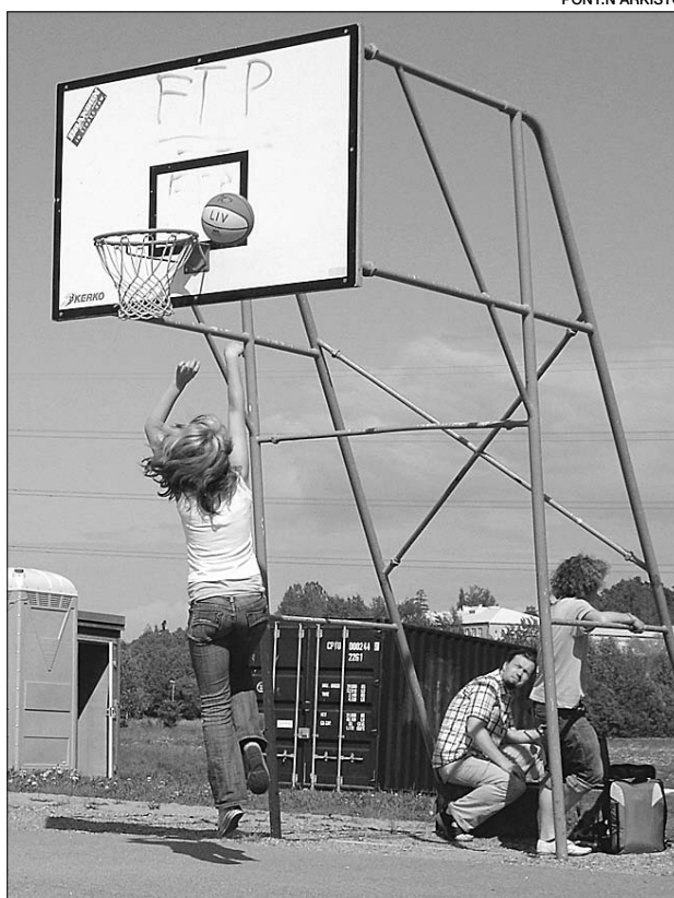
Kesällä aikaa riittää myös erilaisille peleille.

Leirillä on mahdollisuus tutustua eri kulttuureihin ja luoda ystävyysuhteita. Suomalaisten lisäksi leirille osallistuu kymmenen nuorta eri puolilta Eurooppaa.