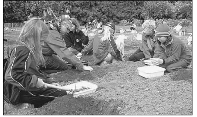
Lapset viljelevät hyöty- ja koristekasveja palstoillaan Kumpulassa.