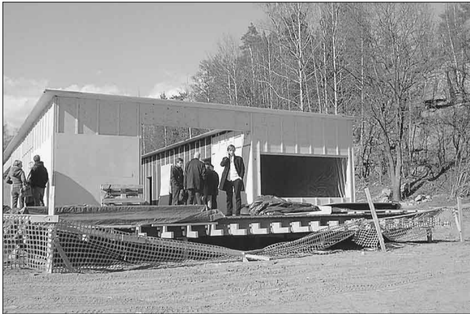
Pikkukosken uuden rakennuksen terassilta avautuu silmiä hivelevä näköala.

Pikkukosken uusi komea uimarakennus on valmistumassa juhannukseksi. Alkuperäisestä aikataulusta on oltu muutama viikko myöhässä. Uuden rakennuksen lisäksi uimarannalla on myllätty melkoisesti. Entisen kosteikon tilalla on uusia pengerryksiä. Uimarannasta on tulossa uusine rakennuksineen hieno ulkoilualue.