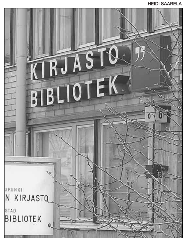
Maunulan kirjasto pysyy auki myös kesällä.