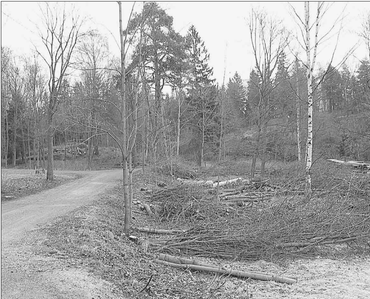
Puuston kaato Pikkukoskella herätti kysymyksiä.