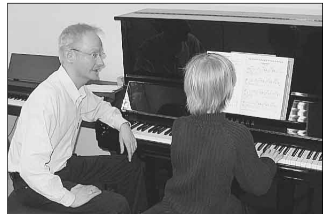
Pianonsoittoon riittää Pakilassa yhä intoa, mutta hakijamäärät ovat laskussa.