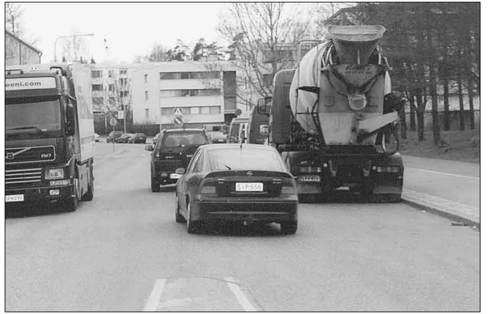
Tämä pattitilanne on viime kuukausina toistunut Mäkitorpantiellä useita kertoja.