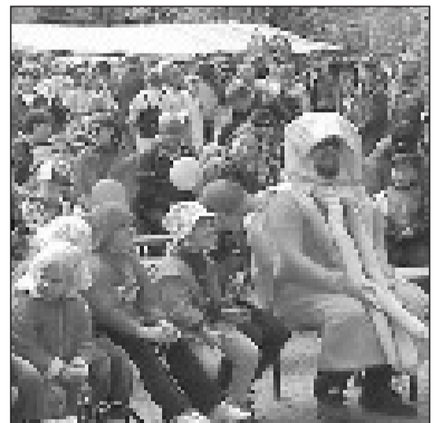
Läntisen nuorisokeskuksen järjestämiä Paloheinäfestareita vietettiin jo 11. kerran Paloheinässä.