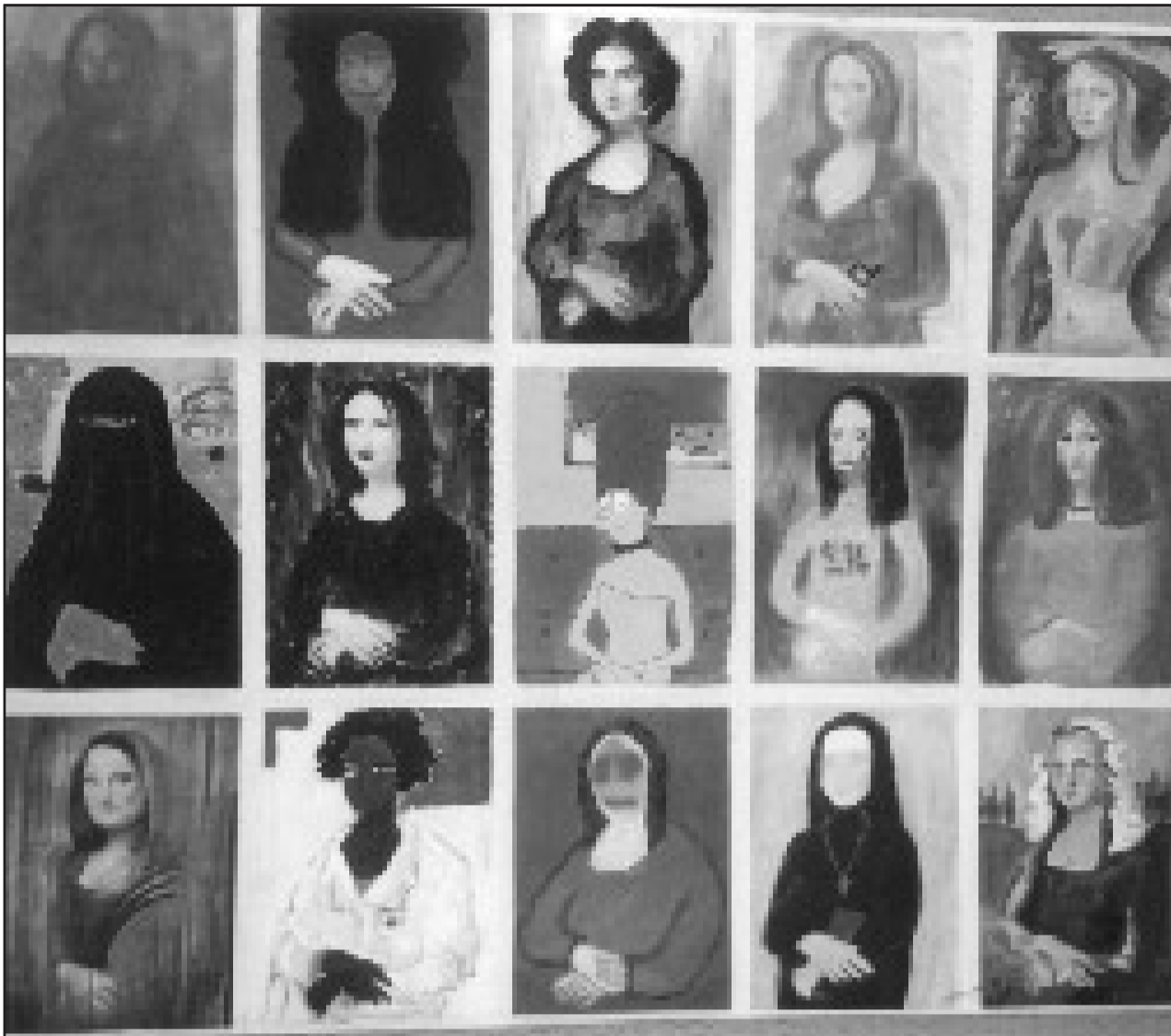
Tämän päivän Mona Liisat, Oulunkylän yhteiskoulun pk:n ja lukion ryhmätyö.