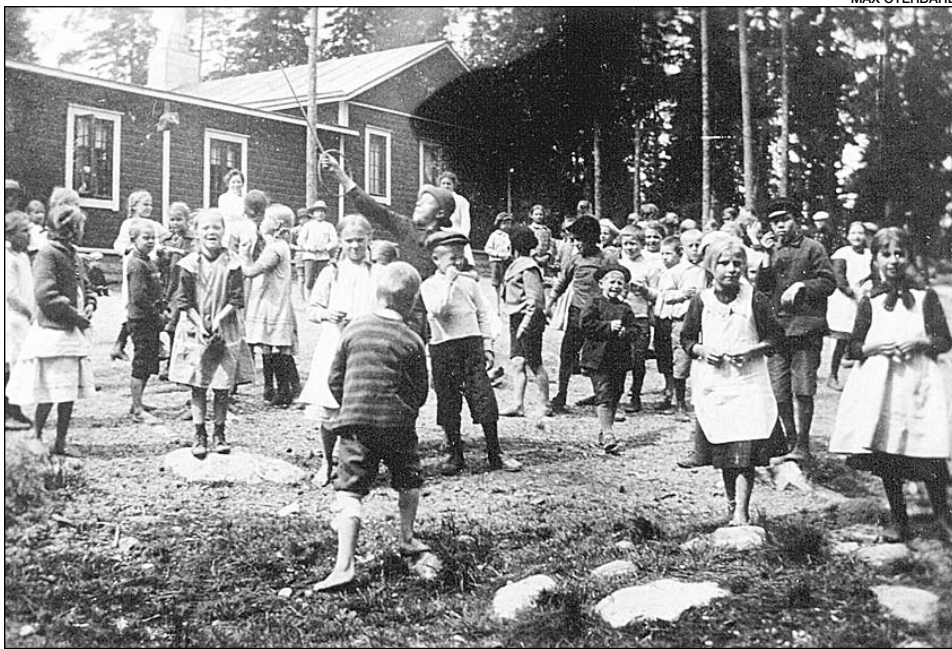
Lägreets lekplan 1916