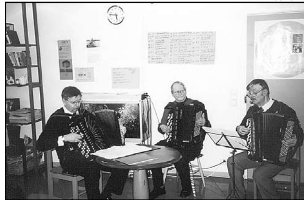
Alueopiston hanuritrio viihdytti kuulijoita kevätkonsertin väliajalla.