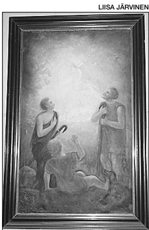
"Enkeli ilmestyy paimenille"