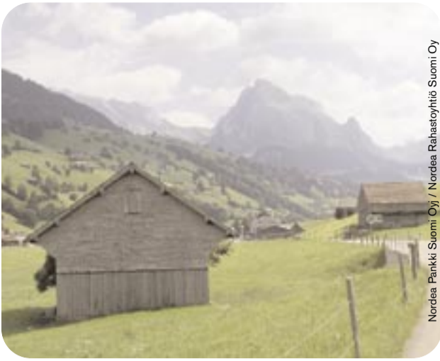
Nordea Pankki Suomi Oy / Nordea Rahastoyhtiö Suomi Oy