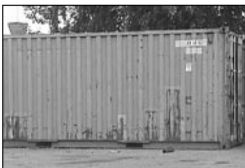
Siisti Stadi -projektin toimesta puhdistetaan jokainen tietoon tullut laitton kaatopaikka.

Ongelmajätteiden keräysauto on liikkeellä ja sen aikataulu selviää lehtien lisäksi osoitteista www.ytv.fi ja ytv@ytv.fi .