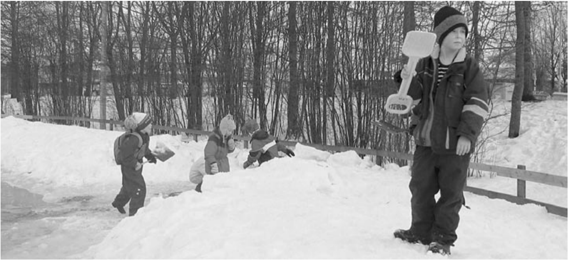
Leikkipuisto Mäkitorpassa iltapäiväkerhon lapset aukovat kevätpuuroja.