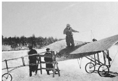
Thoropin lentokone Oulunkylässä v. 1911

torneineen. Vuosisadan vaihteessa Oulunkylä oli maan johtava ravirata. Siellä järjestettiin myös avaraa ulkotilaa vaativia kansanjuhlia, pidettiin pyöräilykilpailuja, Suomen ensimmäinen maratonjuoksukilpailu ja moottoripyöräkilpailu sekä talvella 1911 suuren maailman tyylinen lentoviikko, jota saapui seuraamaan pääkaupungista yli 10 000-päinen yleisö seitsemällä ylimääräisellä junalla.